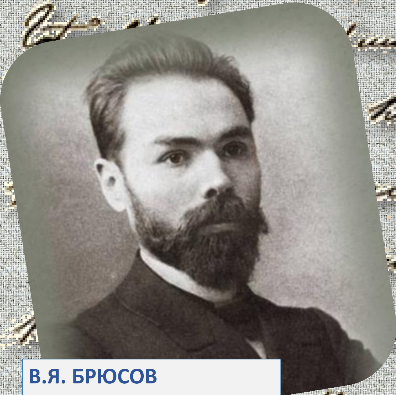
В.Я. БРЮСОВ К САМОМУ СЕБЕ (1900)

Я желал бы рекой извиваться По широким и сочным лугам, В камышах незаметно теряться, Улыбаться небесным огням.